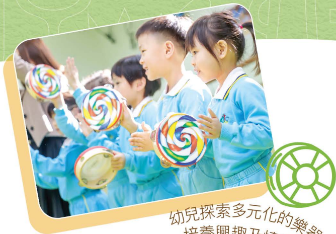
幼兒探索多元化的樂器， 培養興趣及情操