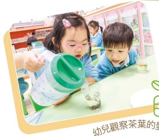
幼兒觀察茶葉的變化

本會幼兒服務同時著重教育與照顧，一方面提供優質的學習課程，幫助幼兒從身、心、靈三方面銜接每一個學習階段；另一方面持續為家庭提供適切且多元化的支援服務，促進幼兒健康成長。本會開辦幼兒服務近半世紀，見證本地幼稚園教育發展里程，積極參與業界討論，為推動優質幼稚園教育獻力。