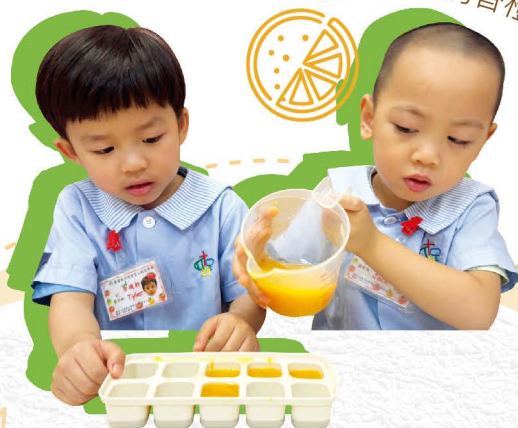
製作冰凍的香橙雪條

在2023-2024學年，學校持續優化音樂課程，為教師安排專業培訓及同儕交流活動，令幼兒在音準、音色、節奏、律動及樂器等音樂能力均有所提升。學校同樣重視培養幼兒對中華文化和傳統藝術的認識，嘗試在學習活動中增添相關元素，例如在「中華文化」專題探索中，幼兒繪畫水墨畫、體驗茶藝文化、製作新年「全盒」，以及了解中國民間故事、音樂及樂器等。此外，學校舉辦「四十周年校慶暨中華文化嘉年華」親子活動，除了與幼兒及家長一起回顧本校四十年的歷史外，亦還設置各式各樣的攤位遊戲，如風箏製作、中國童玩及故事音樂活動等，讓幼兒從小認識中華傳統文化藝術。