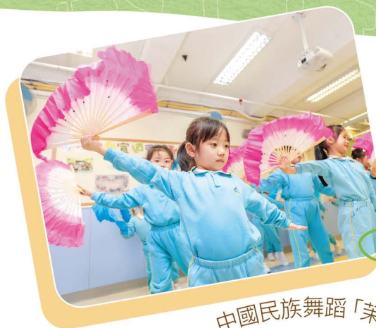
中國民族舞蹈「茉莉花」

來年學校將重點加強幼兒對中華文化及傳統藝術的認識，並透過「優質教育基金」撥款推行「中華文化與藝術計劃」，提升幼兒學習中國傳統藝術的興趣，從而培養幼兒對國民身份的認同。另一方面，學校關顧幼兒情緒及發展需要，在新學年將以「全校參與模式」推行多元融合活動，讓幼兒在情緒管理及人際關係上得到適切的支援，能在群體中愉快地學習和成長。