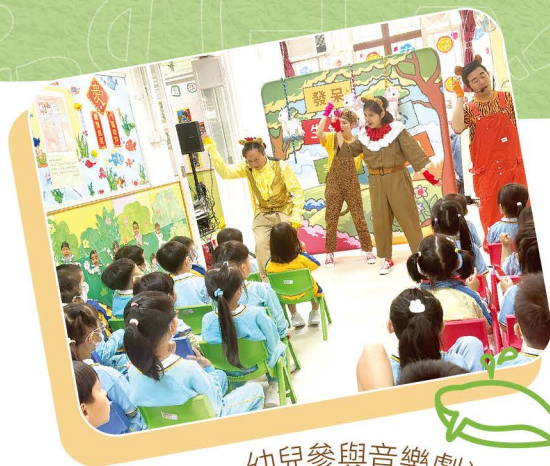
幼兒參與音樂劇活動